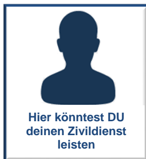
Herr ... Zivildienstler