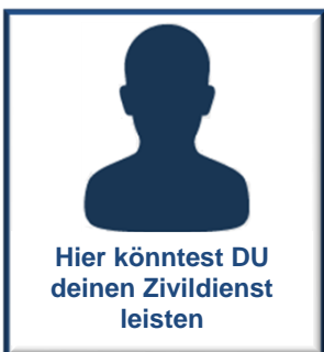
Herr ... Zivildienstler